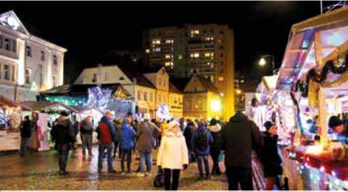
Auf dem Foto der Weihnachtsmarkt vor dem Rathaus von Bielawa