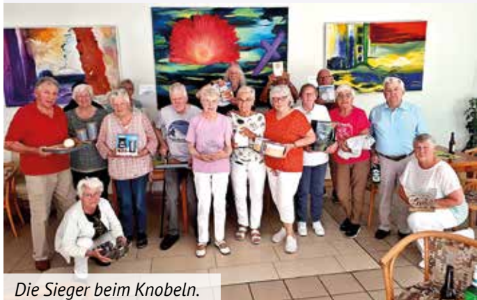
Die Sieger beim Knobeln.