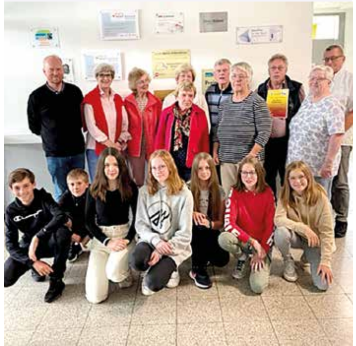
Das Foto zeigt die teilnehmenden Seniorinnen und Senioren sowie Schülerinnen und Schüler nach der Übergabe der Teilnehmerzertifikate.