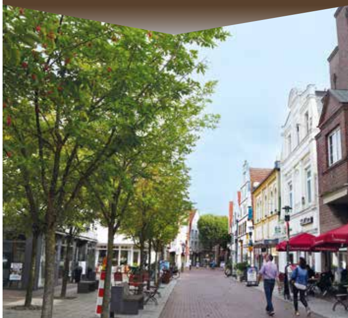
LINGEN GESTERN & HEUTE