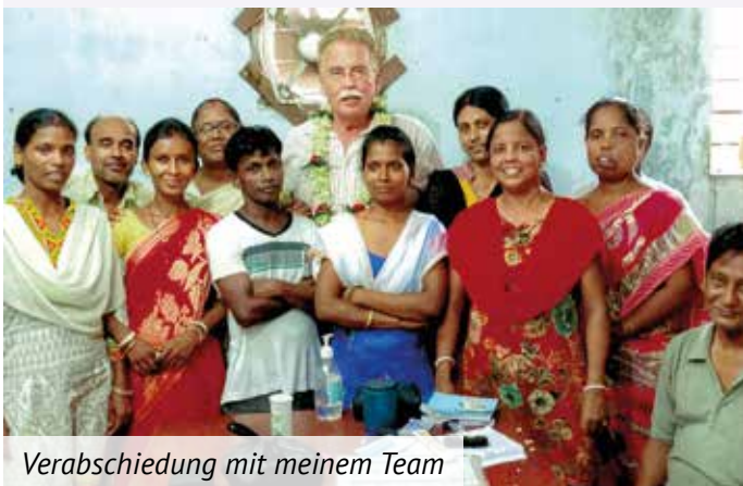
Verabschiedung mit meinem Team

Nicht jedem Patienten können wir helfen, das fällt mir und meinem Team natürlich schwer und belastet uns, da die Menschen ihre ganze Hoffnung auf uns westlichen Ärzten setzen.