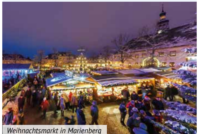
Weihnachtsmarkt in Marienberg

Ein mannigfaltiges Angebot an erzgebirgischer Holzkunst, Kräutern und Gewürzen, Textilien, Kosmetik, Geschenkartikeln und natürlich vielen duftenden und wohlschmeckenden Leckereien bietet der Marienberger Weihnachtsmarkt. Auch in diesem Jahr wird er drei Wochen geöffnet sein. Ein abwechslungsreiches kulturelles Rahmenprogramm sorgt für vorweihnachtliche Stimmung.