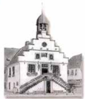
SENIORENVERTRETUNG IN DER STADT LINGEN (EMS)

08. bis 12. November 2021 - Neues Rathaus Lingen